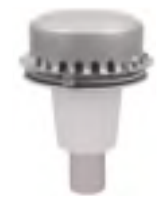
LORO DW- Einläufe Serie DRAINJET - 27.0 l/s für große Ablaufmengen